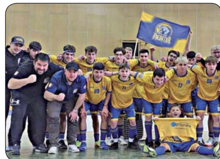
16 | Úspech florbalistov Dorastenci postúpili medzi najlepšiu osmičku Slovenska