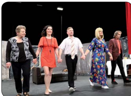
13 | Sabinovskí ochotníci po rokoch opäť zahviezdili Tentokrát komédiou Natierač